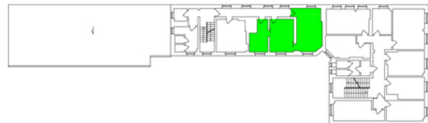
RZUT III PIĘTRA